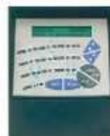
Gestor aperturas Ev'Hora